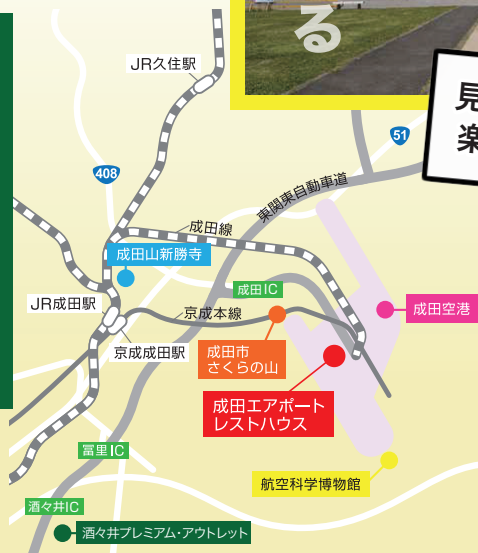
酒々井プレミアム・アウトレット