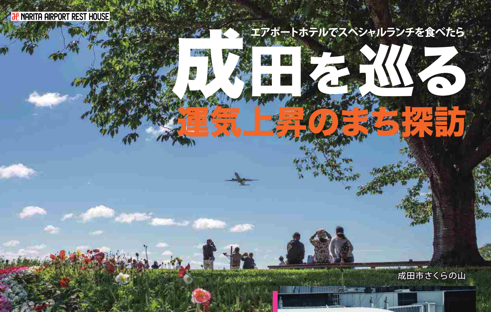
成田市さくらの山